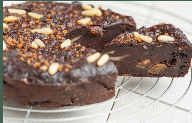
La Torta paesana