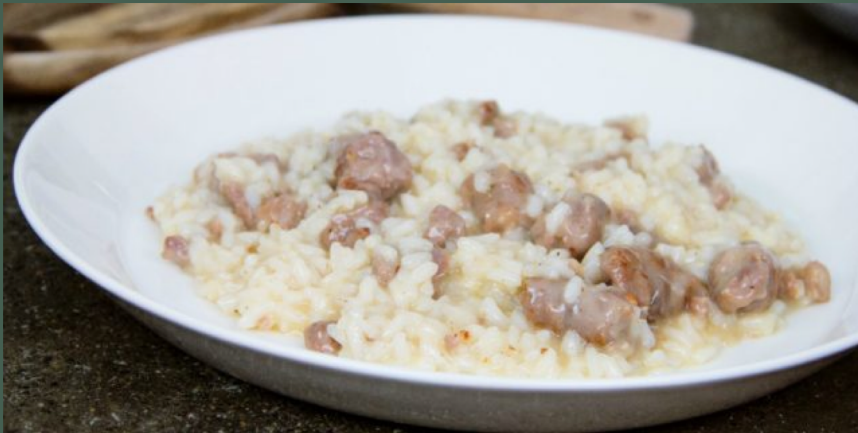
Il Risotto alla Monzese